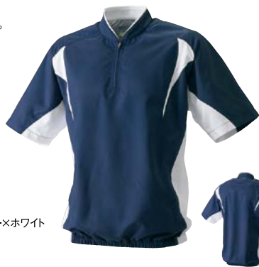
7010 ネイビー×ホワイト