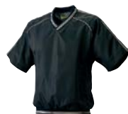
9010 ブラック×ホワイト