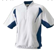
1070 ホワイト×ネイビー