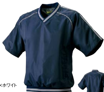
7010 ネイビー×ホワイト