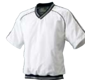
1090 ホワイト×ブラック