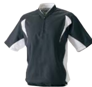
9010 ブラック×ホワイト