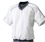
1070 ホワイト×ネイビー