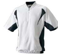
1090 ホワイト×ブラック