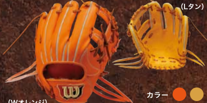
(Wオレンジ) カラー ● ● ● ● WTAHWK69L [右投げ]