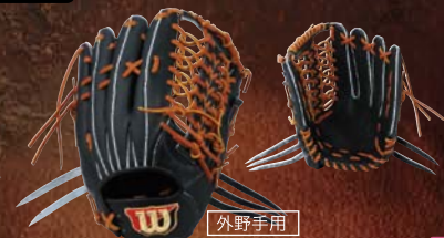
(ブラックSS) 外野手用 WTAHWK8L [右投げ] WTAHWK8R [左投げ]