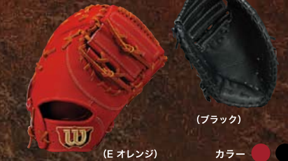
(E オレンジ) カラー ● ● ● ● WTAHWK3L [右投げ] WTAHWK3R [左投げ]