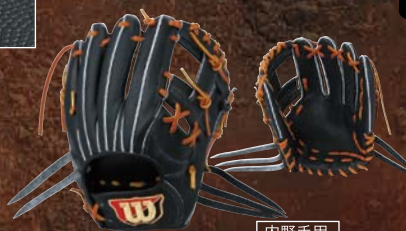
(ブラックSS) 内野手用 WTAHWK6L [右投げ]