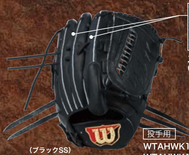
(ブラックSS) 投手用 WTAHWK1SL [右投げ] WTAHWK1SR [左投げ]