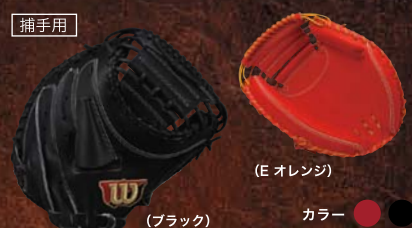
捕手用 (E オレンジ) カラー ● ● ● ● WTAHWK2L [右投げ]