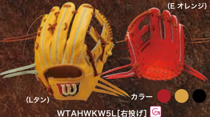
(Lタン) カラー ● ● ● ● WTAHWK5L [右投げ]

はめた瞬間から手に馴染み、即使用をイメージさせる仕上げ。(プロストック ステアレザー仕様)