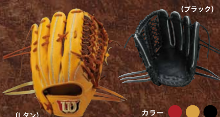
(Lタン) カラー ● ● ● ● WTAHWK8L [右投げ] WTAHWK8R [左投げ]