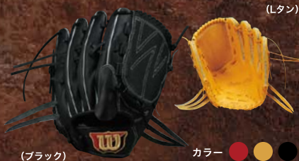
(Lタン) カラー ● ● ● ● WTAHWK1SL [右投げ] WTAHWK1SR [左投げ]